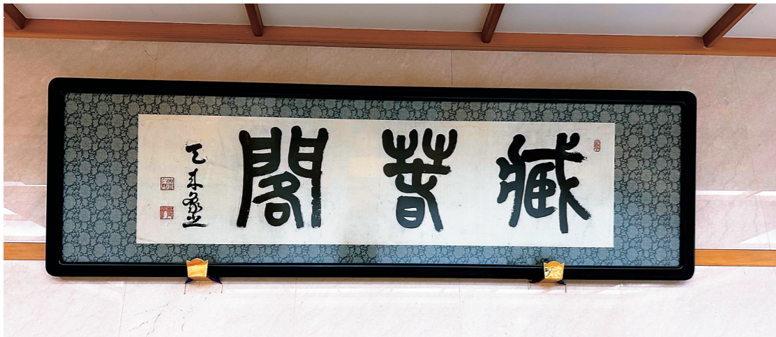
図1 比田井天来筆《蔵春閣扁額》北海道神宮所蔵

現在、北海道神宮内に、書家の比田井天来筆《蔵春閣扁額》が掲げられているとの情報もいただいた（図1）。比田井天来（1872～1939）は、明治書道界の第一人者である日下部鳴鶴（1838～1922）に学び、古碑法帖を多角的に研究、古典臨書の新分野を開拓し、その独創性により「現代書道の父」と呼ばれた書家である〔注2〕。本作は天来の傑作の一つに数えられる篆書体の書額である。