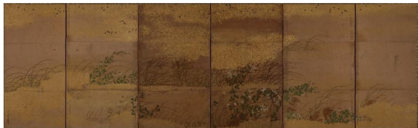
No.13 住吉如慶〈秋草図屏風〉6曲1双 (左隻)