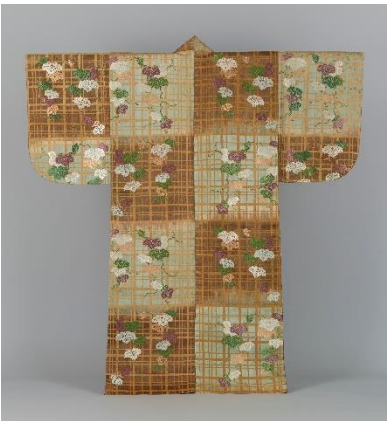
No.8 能装束〈浅黄茶段格子蔦模様唐織〉