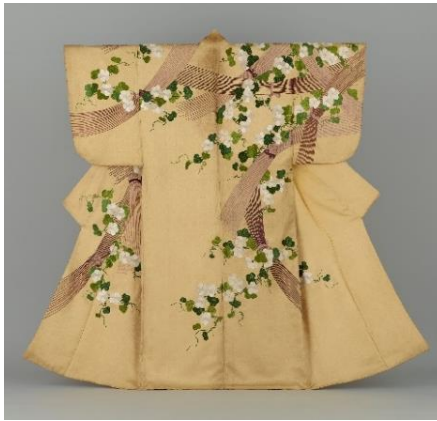
No.9 能装束〈鬱金地垣夕顔模様縫箔〉