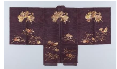
No.10 能装束〈紫地棕栢模様長絹〉