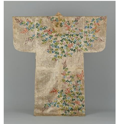
No.7 能装束〈白地銀豎縞萩蜘蛛巣模様縫箔〉