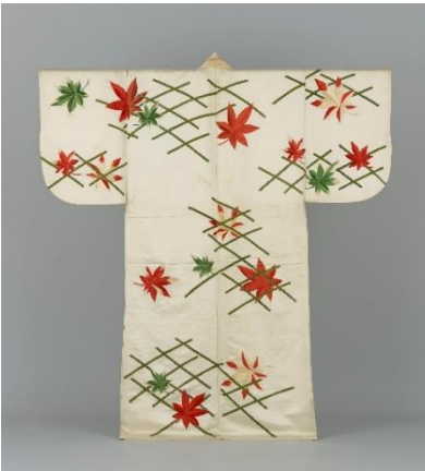
No.5 能装束〈白地破菱紅葉模様縫箔〉