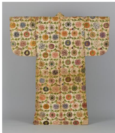
No.6 能装束〈白地石畳菊唐草模様唐織〉