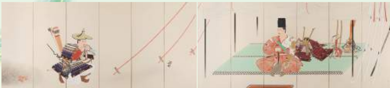
重要文化財《黄瀬川陣》安田靱彦 昭和15/16年(1940/41)東京国立近代美術館蔵【後期展示】