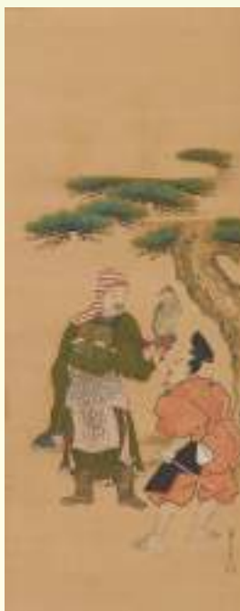
《鷹狩図》狩野典信 江戸時代18世紀 東京国立博物館蔵(3幅対のうち) Image: TNM Image Archives 【後期展示】

平安時代後期、武士が歴史の舞台に上り、後に国を支配するにいたると、絵画に武士の姿が描かれるようになります。戦の様子を描く合戦図、武士の頭領の姿を描く武人肖像画などとともに、武力や権力を象徴するモチーフなども描かれました。