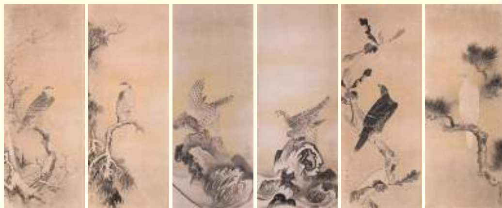
《鷹図》 曾我二直庵 江戸時代・17世紀 個人蔵(12幅のうち) 【前期展示】