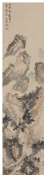
青木木米筆 《山中煎茶図》 大倉集古館蔵

東京に生まれ、6歳からサンフランシスコ、ボストン、パリで育つ。2007年ウォールナットヒル芸術高校卒業、ニューイングランド音楽院プレパラトリーディヴィジョン最優秀賞を得て終了。フォンテンヌブロー城の音楽祭でフィリップ・アントルモン氏に見いだされパリに渡仏。2008年サル・ガヴォーにてコンチェルトデビュー。その後ベルギー国立管弦楽団、サントドミンゴ管弦楽団、パームビーチシンフォニー、テアトロジリオ管弦楽団、パリ国際大学都市管弦楽団及びパリ管弦楽団などと共演。2012年シャネルピグマリオンデザイン参加アーティスト。2013年にジェラルド・プーレ、菅野博文両氏とピアノトリオを組み数々の演奏会を行う。英国王立音楽アカデミー修士課程終了。2020年1月にはベルギー各地でオーケストラとのピアノコンチェルトツアーが行われた。2020年9月と2021年5月に大倉集古館にてリサイタルを行った。