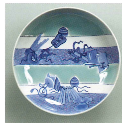
「青磁染付宝尽文大皿」

主催 公益財団法人 大倉文化財団・大倉集古館 〒105-0001 東京都港区虎ノ門2-10-3 (The Okura Tokyo正面玄関前) TEL 03-5575-5711 (代表) ホームページ http://www.shukokan.org