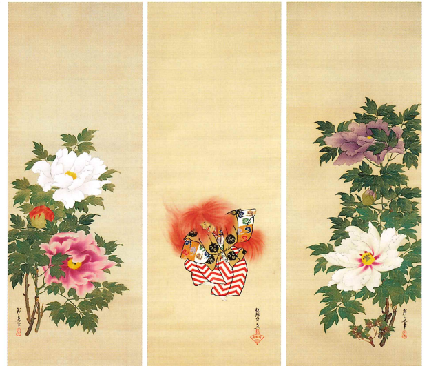
鈴木守一筆「石橋・牡丹図」