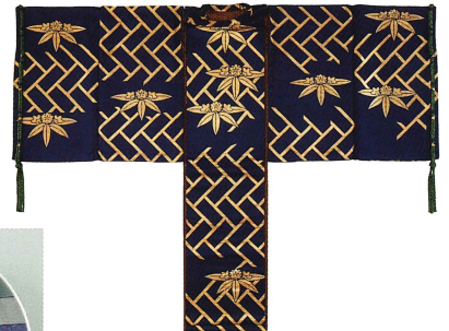
「花色地破檜垣笹竜胆模様袷狩衣」